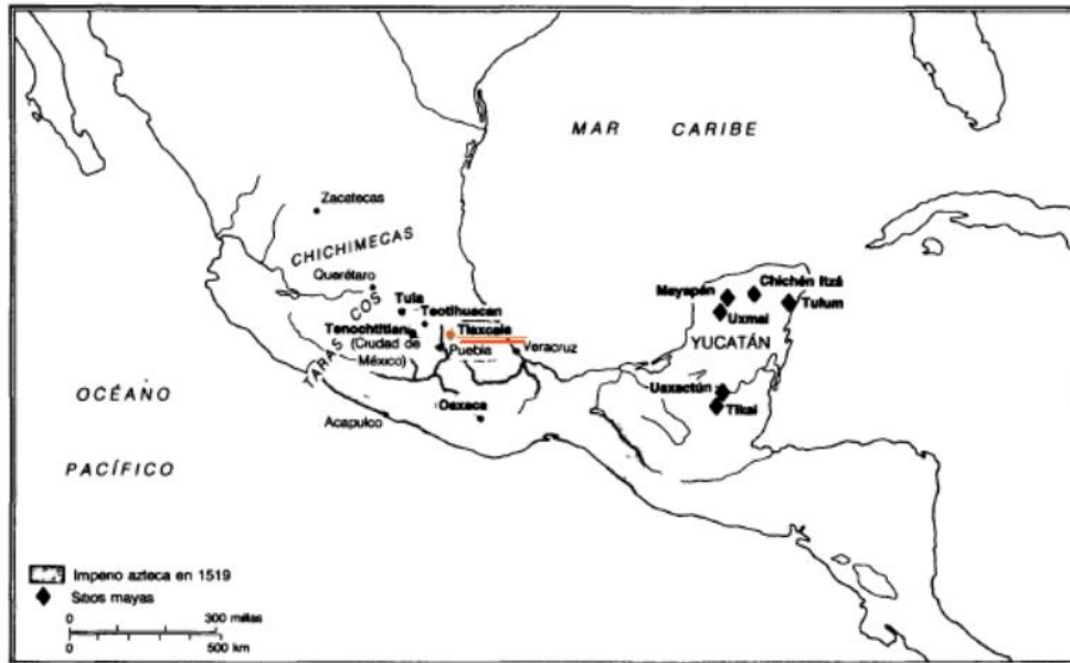
Mesoamérica antes de 1519

Tlaxcala es un estado de México que se localiza geográficamente en la región Centro-Oriental de la República Mexicana. Colinda al noroeste con el Estado de Hidalgo; al norte, sur y este con el Estado de Puebla y al oeste con el Estado de México., esta región estaba separada del valle de México por dos volcanes, lo cual le permitió, debido a su aislamiento geográfico con otras tribus nahuas, un desarrollo regional con fuertes lazos de unión y particularidades que los diferenciaron de sus vecinos. Esta situación también trajo aparejado que la zona no cayera bajo el dominio de las tribus mexicas que gobernaban el imperio desde Tenochtitlán.