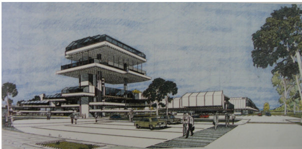
Imagen 2. Perspectiva peatonal del conjunto

Al respecto cabe destacar que en nuestro medio, desde mediados de los ´60 comenzaron a desarrollarse distintos instrumentales y recursos tecnológicos (hardware y software) que incrementaron las herramientas disponibles para dibujantes y diseñadores. Estas nuevas posibilidades gráficas -en un principio destinadas a una “elite tecnológica”-, vinculadas con la expresión o transmisión de ideas y con la retroalimentación del arquitecto durante las distintas instancias del proceso proyectual, debieron vencer las objeciones y cuestionamientos que en un primer momento se le realizaron. Cuestión que, desde los ´80, con el desarrollo de los Procesadores Personales (PC) y su producción masiva, se modificó dando lugar a la irrupción de los medios digitales en todos los ámbitos y actividades.